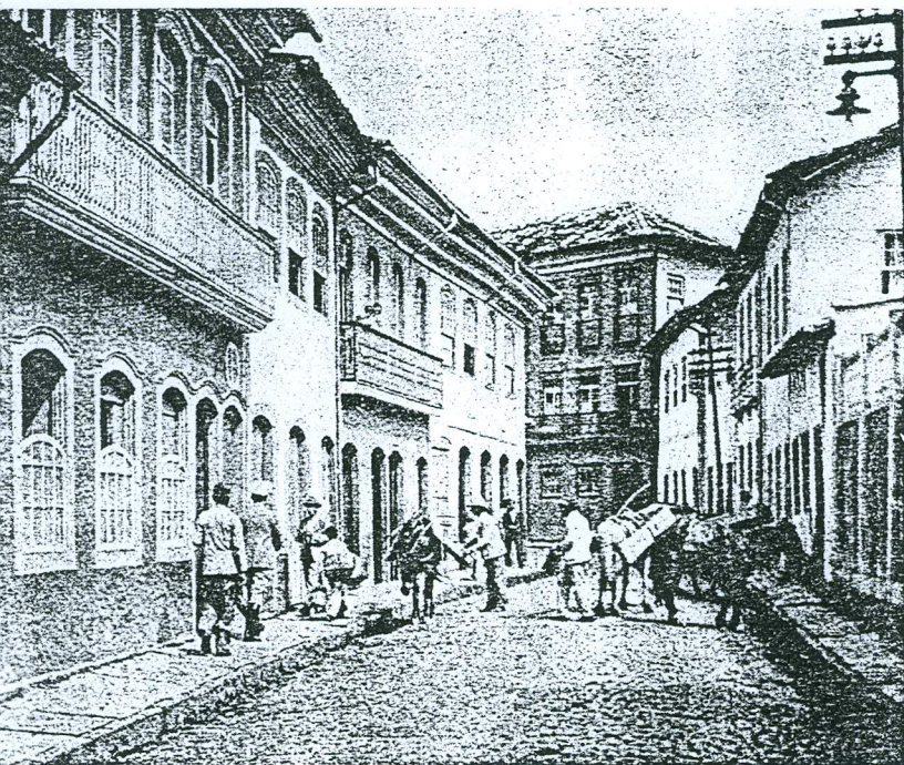
Velhos sobradões de uma rua principal, e um pouco de sua vida que não muda